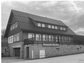
Roubenka MAJÁK - Centrum průšvihů